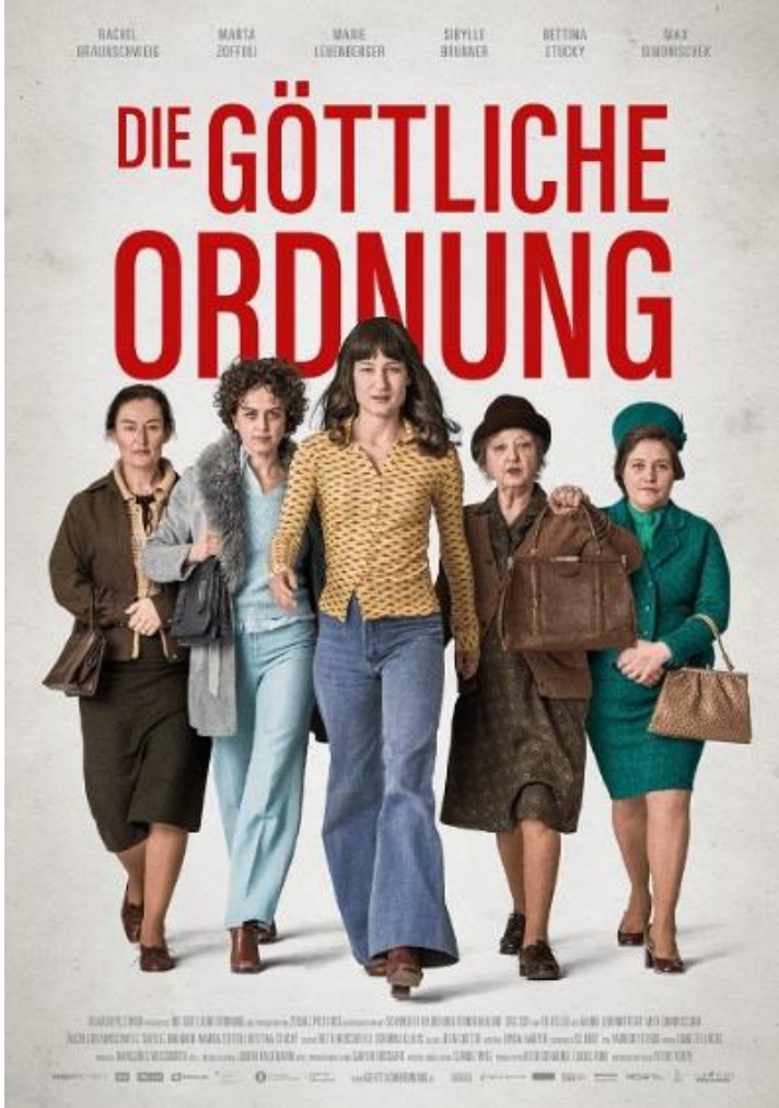
Filmplakat - 2017 - Die göttliche Ordnung - Petra Volpe : Filmregisseurin in der Schweiz