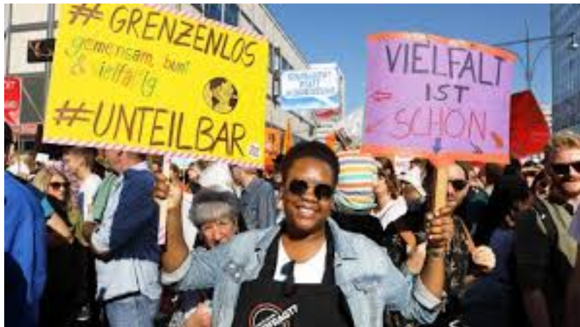
Foto: Eine Demonstration für Vielfalt im Oktober 2018 in Berlin