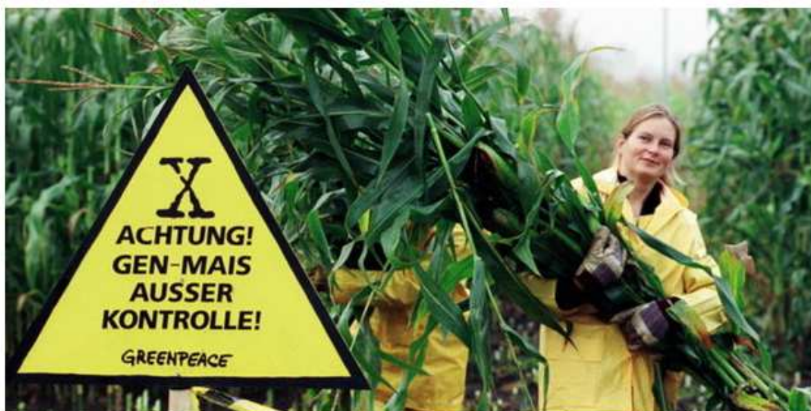
Wie gefährlich sind gentechnisch veränderte Pflanzen? Nicht nur Greenpeace, auch kritische Wissenschaft warnen vor unabsehbaren Folgen. Bild: dpa

Foto aus der TAZ (Tageszeitung) – „Risiken der Gentechnik“ – Mai 2010