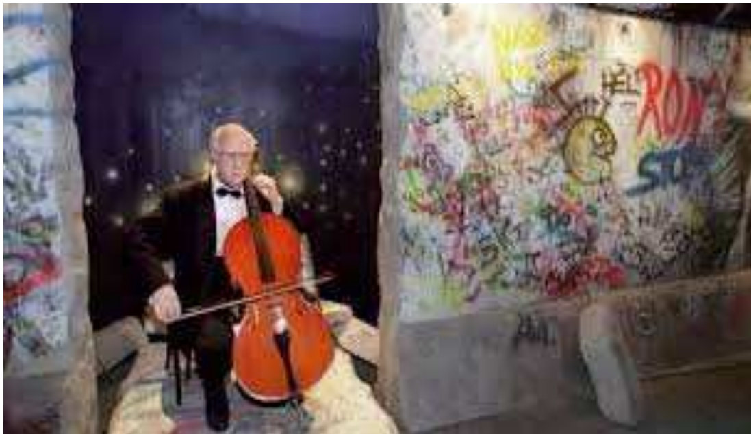
“Mauern sind nicht für ewig gebaut. In Berlin habe ich für mein Herz gespielt“, der Cellist Rostropowitsch am 11.November 1989.