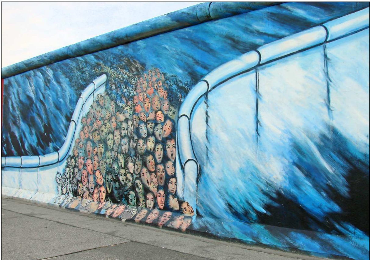
Source: Wandbild von Kani Alavi: „Es geschah im November“ East Side Gallery, Berlin Kreuzberg, 1991