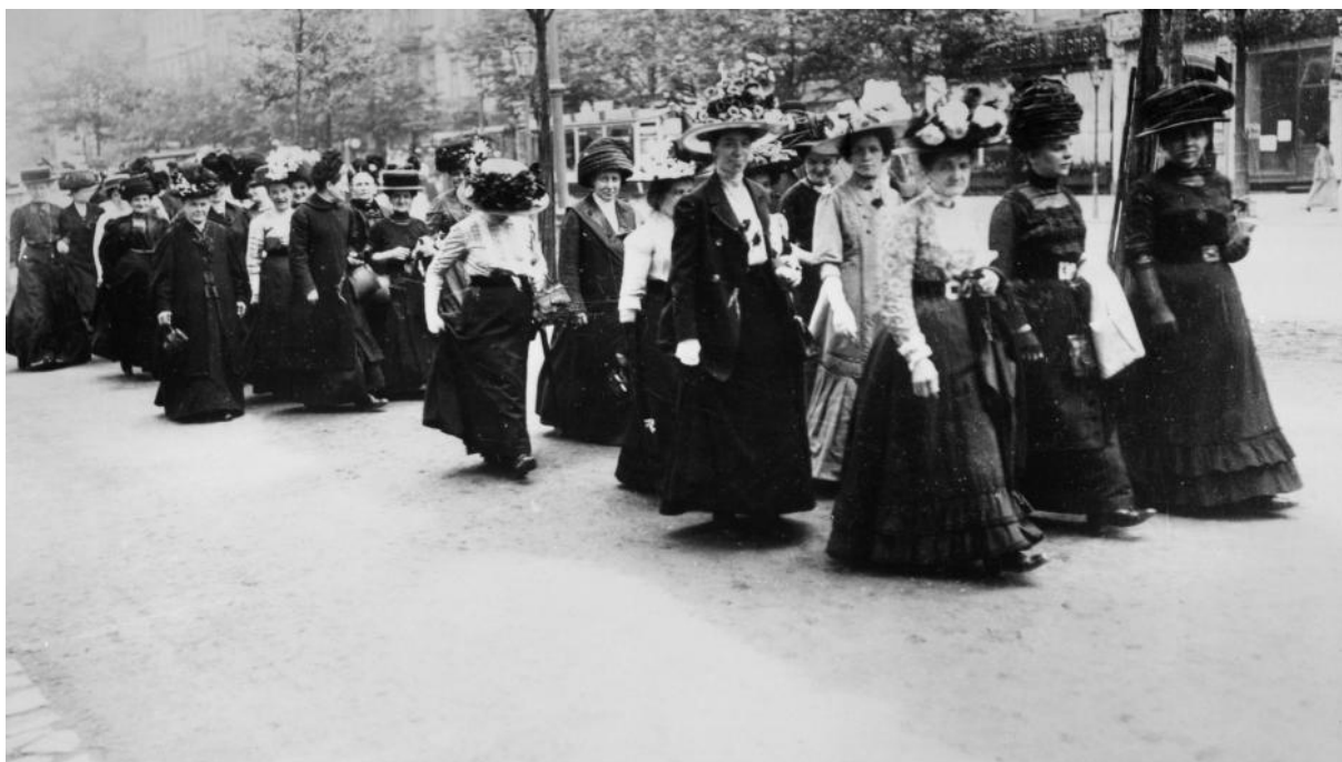
„Als die Frauen sich das Recht zur Wahl nahmen“ Augsburger Allgemeine 09.11.2018