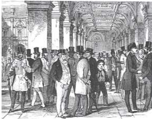
Privatsphäre der Männer und Frauen Abb.: England, 1845 - 1847