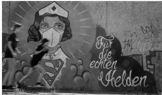
Super Nurse von dem Künstler „The Uzey“, 2020.

In unseren heutigen Gesellschaften stehen oft anonyme Leute im Mittelpunkt des Interesses.