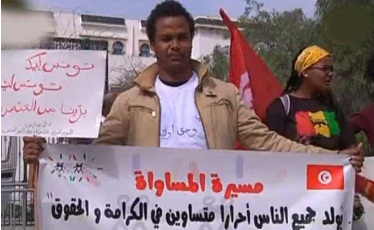
صورة تم التقاطها خلال مسيرة المساواة التي جمعت العشرات في تونس العاصمة 21 مارس 2014