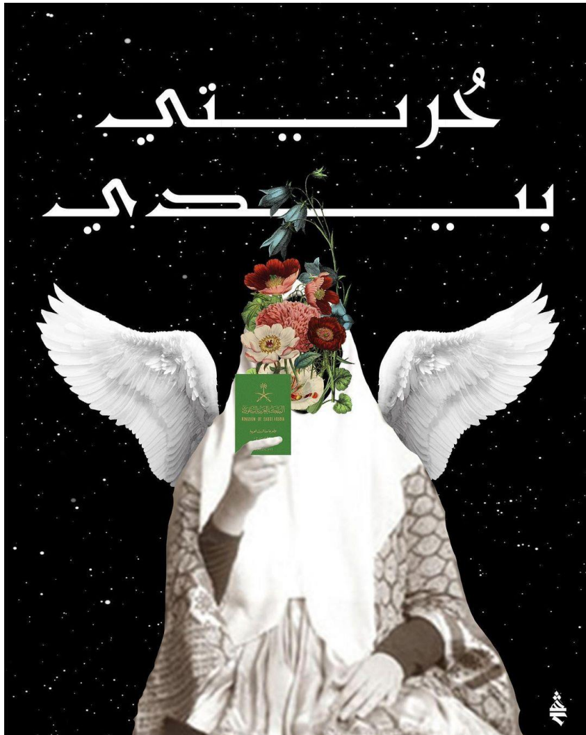
شهد ناظر، حريتي بيدي (2019)