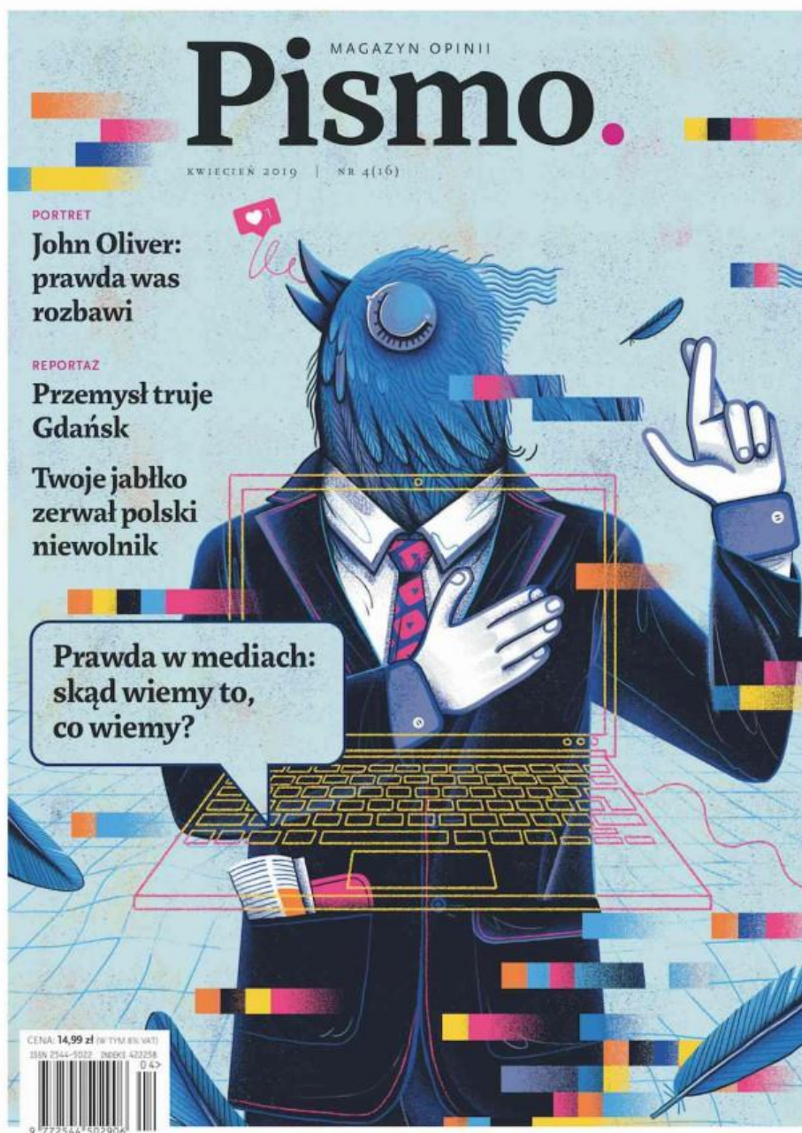
Okladka magazynu Pismo , kwiecień 2019

„Prawda w mediach. Skąd wiemy to, co wiemy? Czy prawda w tak spolaryzowanym społeczeństwie jest jeszcze komukolwiek potrzebna? Czy dziennikarz powinien się dostosowywać do przekonań swoich odbiorców czy też ma ich wybijać ze strefy komfortu?“, redakcja magazynu Pismo