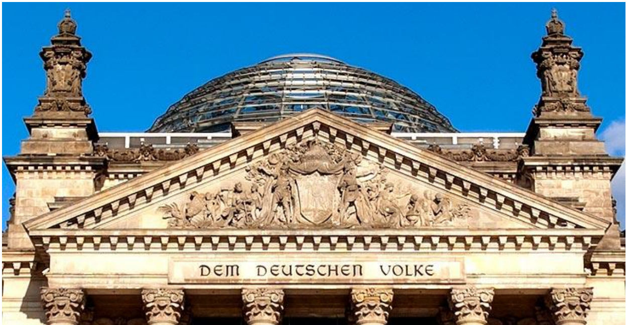
Foto: Gebäude des Reichstags in Berlin, Sitz des Bundestags. „Dem Deutschen Volke“

Norbert Lammert (letzte Bundestagsrede, 05. September 2017)