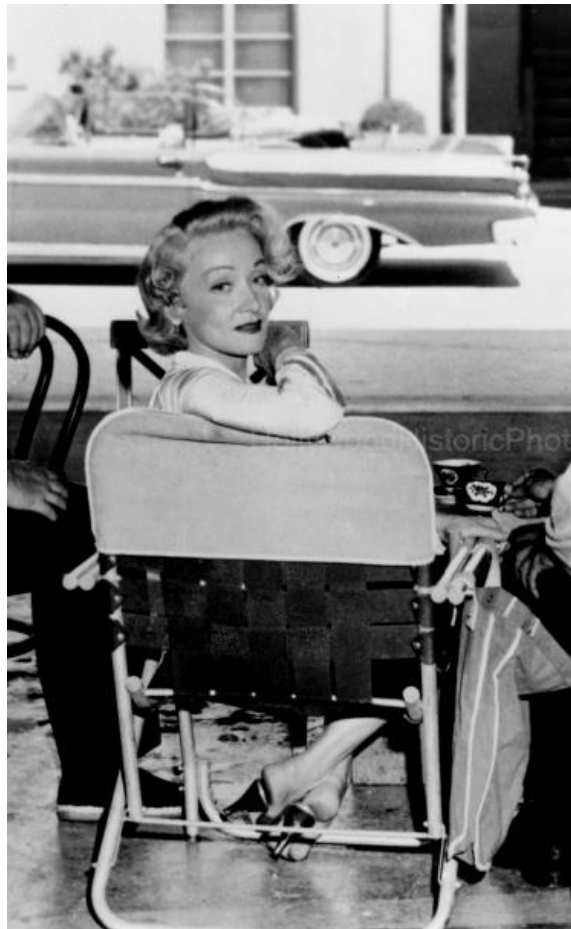
Foto : Marlene Dietrich in Hollywood, 1957

http://hollywoodhistoricphotos.com/popup_image.php/pld/4807