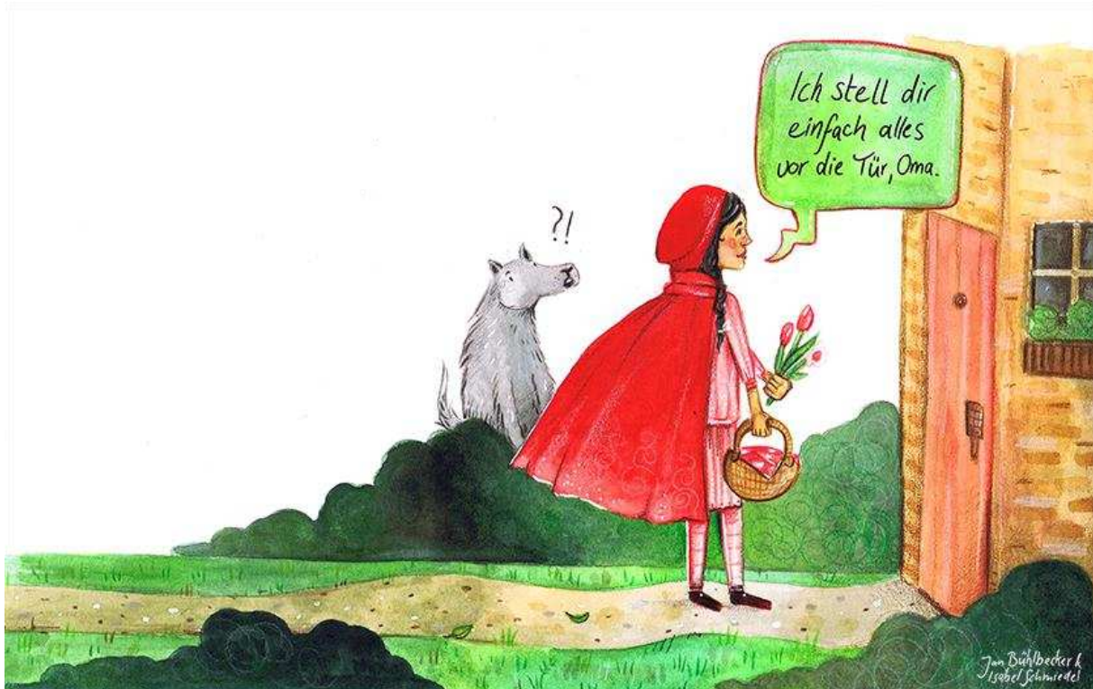
Bild – Jan Bühlbecker und Isabel Schmiedel - Comics für den Weltfrieden – April 2020 – #deutschemaerchenstrasse

Was wird aus Rotkäppchen, wenn es seine Großmutter nicht mehr besuchen kann?