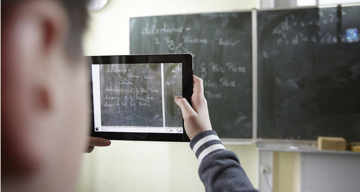
Foto – Digitalisierung an Schulen, Berlin, Juni 2020 Wie Schüler und Lehrer mit privaten Geräten die Corona-Krise meistern

www.gew.de/aktuelles/detailseite/neuigkeiten/ein-hoch-auf-das-improvisationstalent/