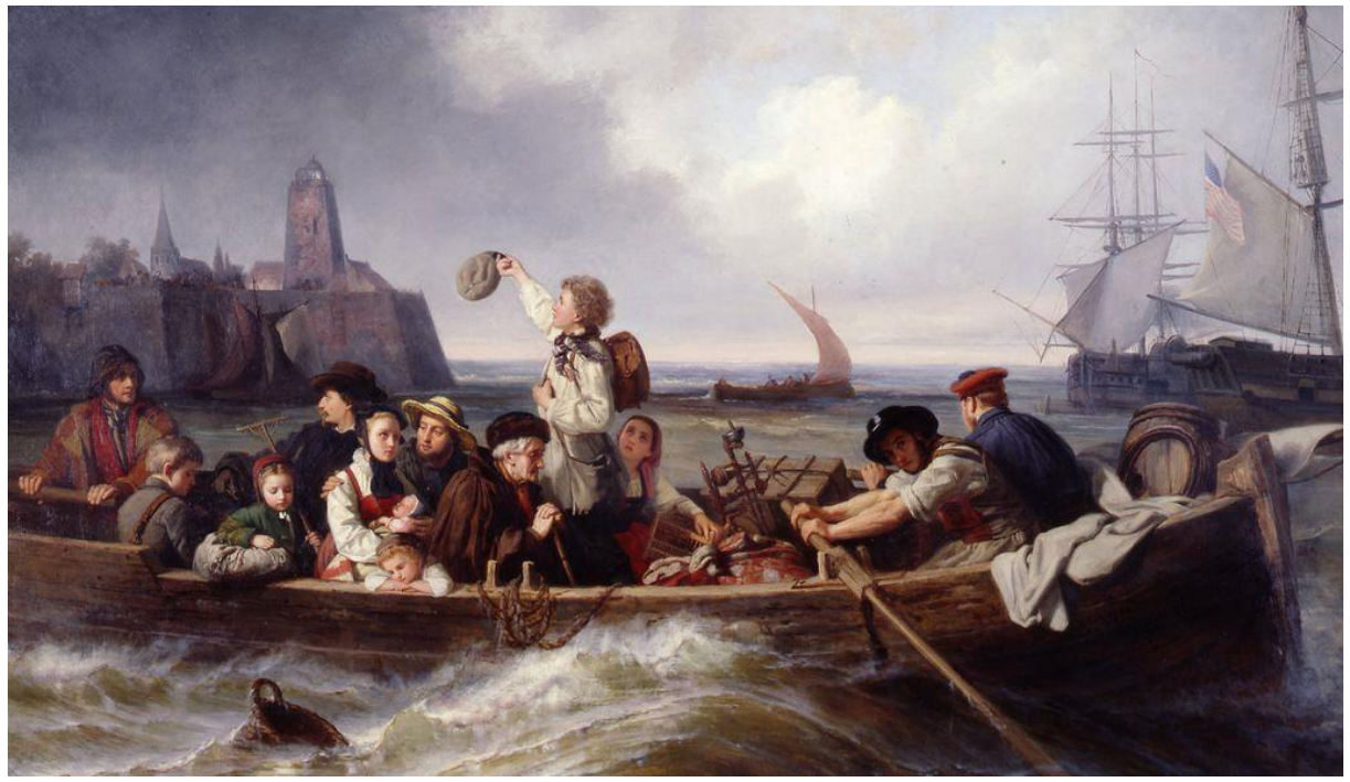
Gemälde von Antonie Volkmar, Abschied der Auswanderer , 1860