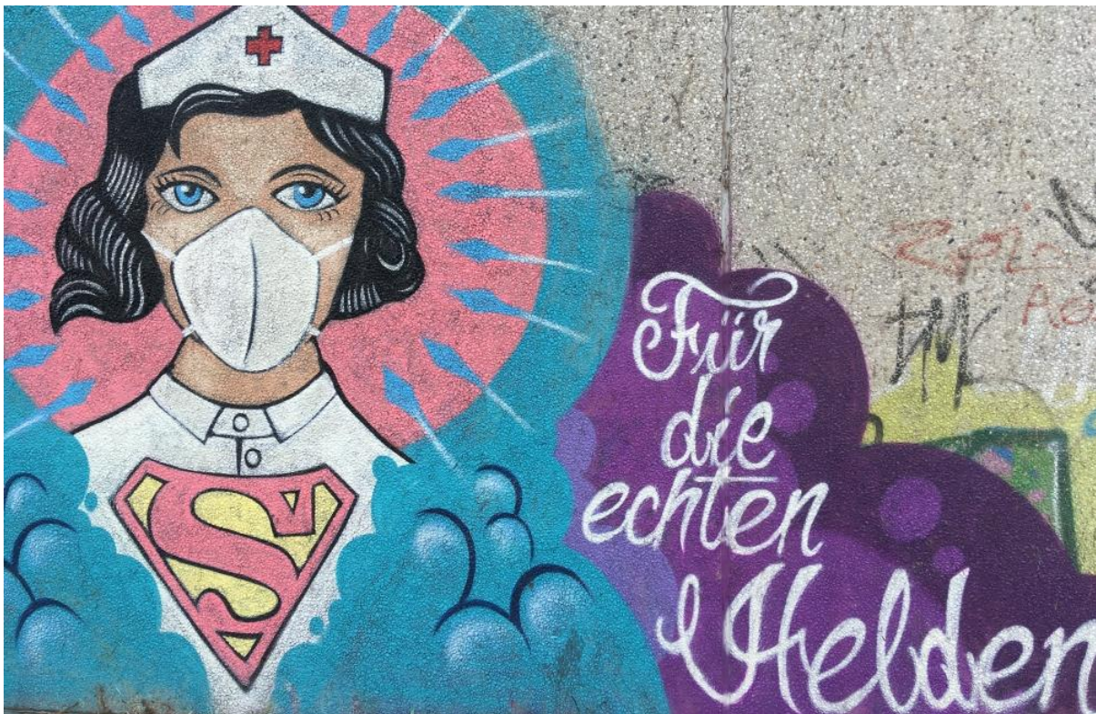
Foto – Street Art in Hamm