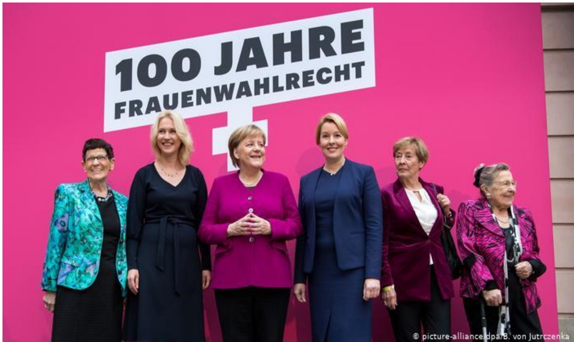
Foto - Hundert Jahre Frauenwahlrecht und noch viel zu tun

100 Jahre nach der Einführung des Frauenwahlrechts in Deutschland ist der Kampf immer noch aktuell.