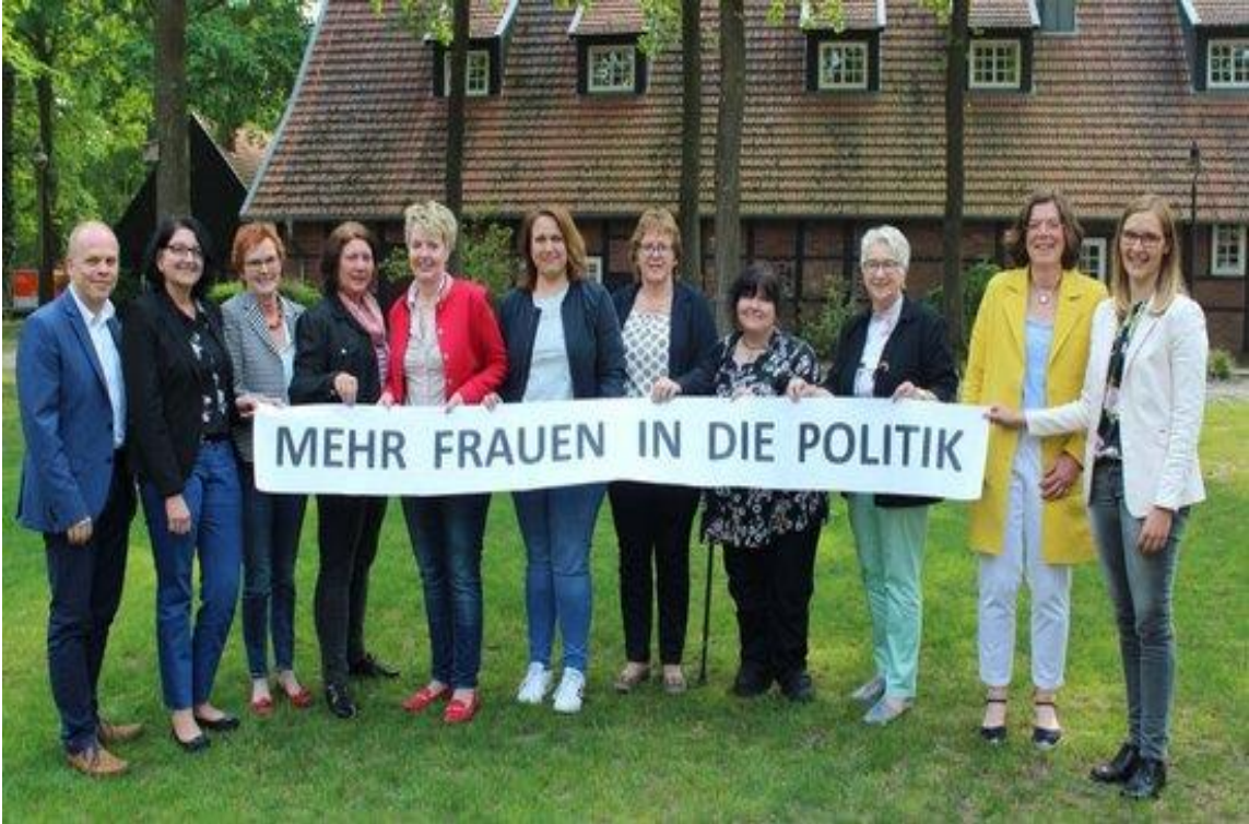
„Mehr Frauen in die Politik“