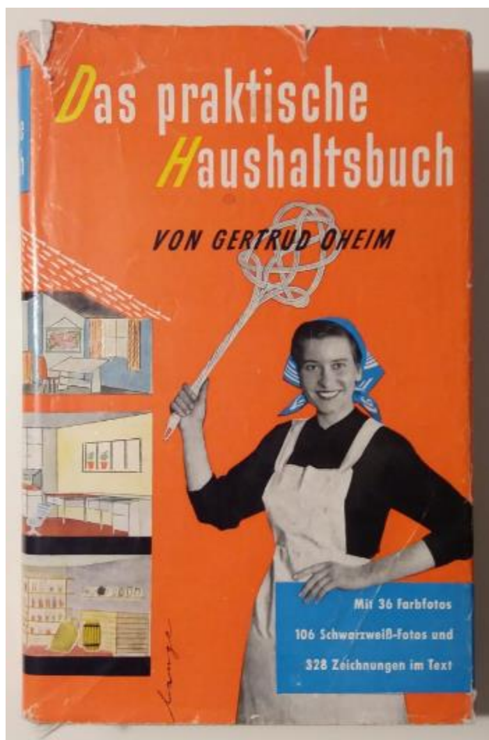
Buchcover – Das praktische Haushaltsbuch – 1954 – Gertrud Oheim Mit 36 Farbfotos, 106 Schwarzweiß-Fotos und 328 Zeichnungen im Text