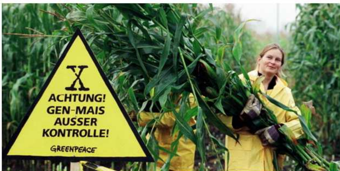
Wie gefährlich sind gentechnisch veränderte Pflanzen? Nicht nur Greenpeace, auch kritische Wissenschaft warnen vor unabsehbaren Folgen.