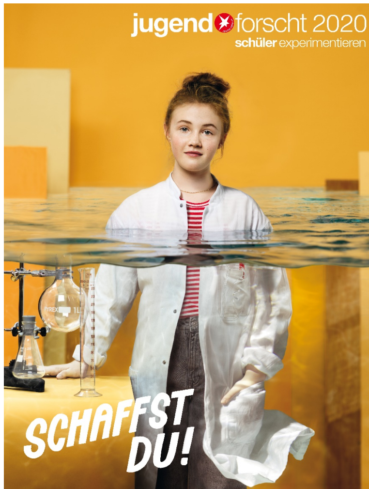
Plakat vom Wettbewerb „Jugend forscht“ – 2020