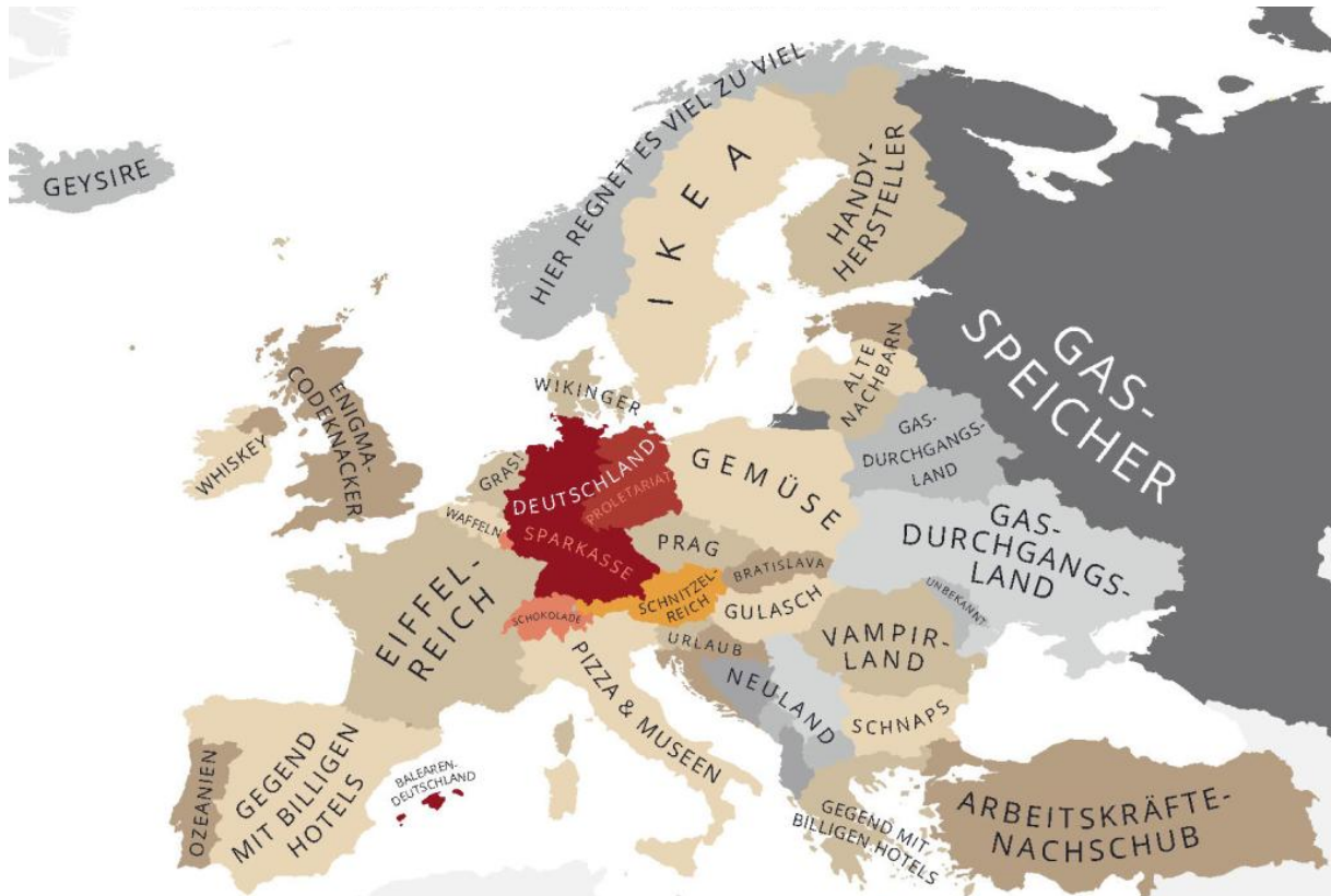
- Europa aus der Sicht von Deutschland -

Aus: Yanko Tsvetkov , Atlas der Vorurteile , Knesebeck Verlag (2013).