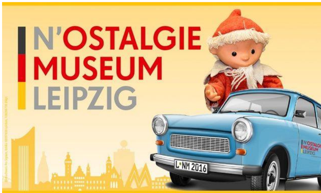
Plakat des Museums