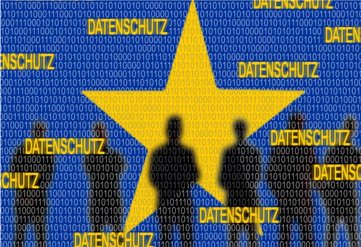
Europa schützt die europäischen Bürger vor der Nutzung ihrer Internet-Daten Plakat zur Einführung der EU-Datenschutzverordnung, 2018