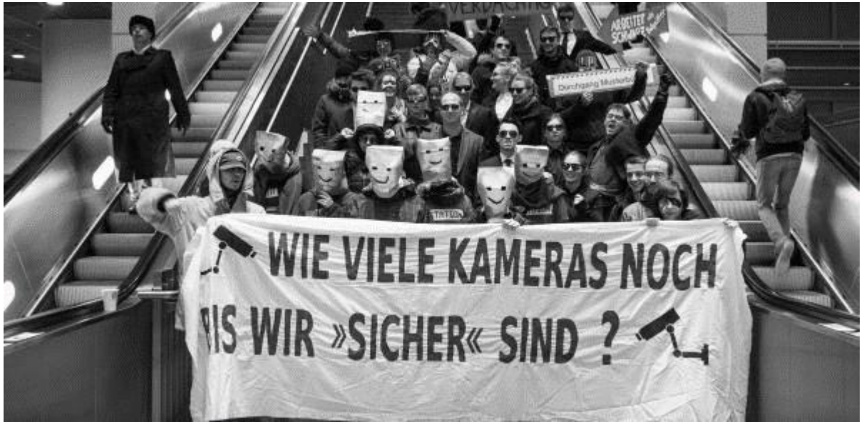
Protestaktion gegen Videoüberwachung und Gesichtserkennung in Berlin Südkreuz.

Erklären Sie, was Sie persönlich von solchen Protest-Aktionen halten und wie man sich am besten für oder gegen eine Politik engagieren kann. Sich informieren? Mit anderen Menschen sprechen? An Aktionen teilnehmen?