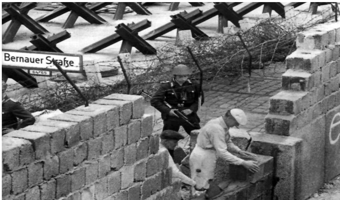
Bau der Berliner Mauer, 13. August 61