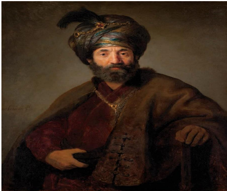
"גבר בלבוש אוריינטלי", רמברנדט, 1634 3 "Homme en costume oriental", Rembrandt, 1634, National Gallery of Art, Washington, DC