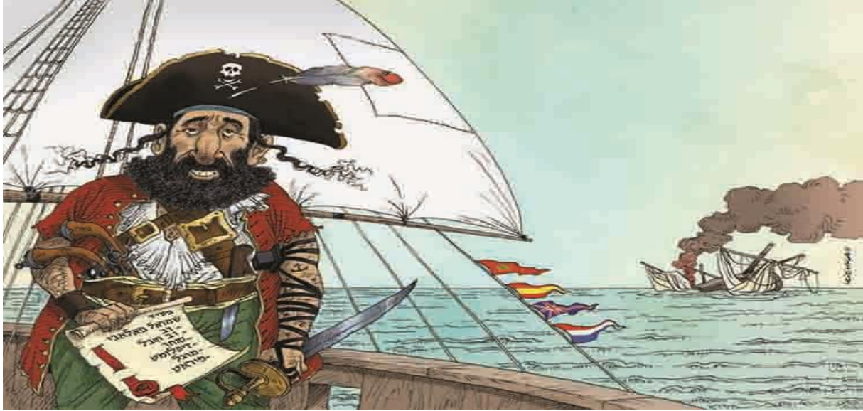
הרב שמואל פלאג'י. איור: מישל קישקה