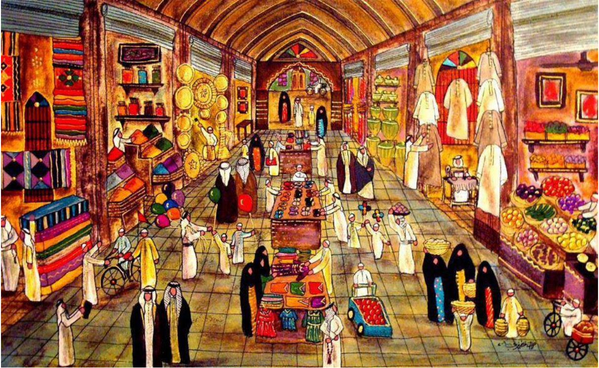
لوحة للفنانة العراقية ضحى الخضيرى ترسم فيها أحد أسواق بغداد تاريخ مجهول