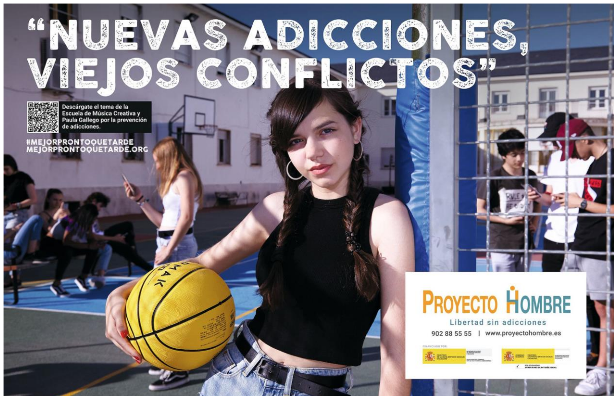
Campaña de prevención de las adicciones (España, Canarias, 2019)