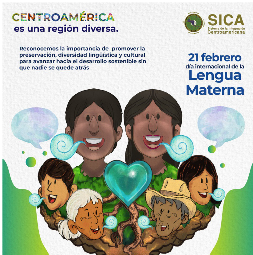
Cartel publicitario de la SICA para promover la diversidad de las lenguas