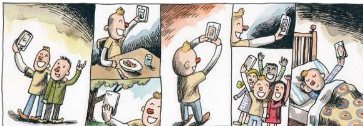
Macanudo, Liniers (dibujante argentino), Nuevas tecnologías