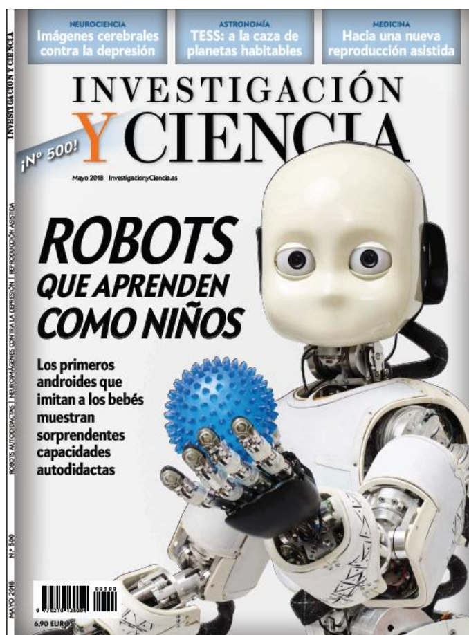
Portada de la revista Investigación y ciencia , mayo de 2018.