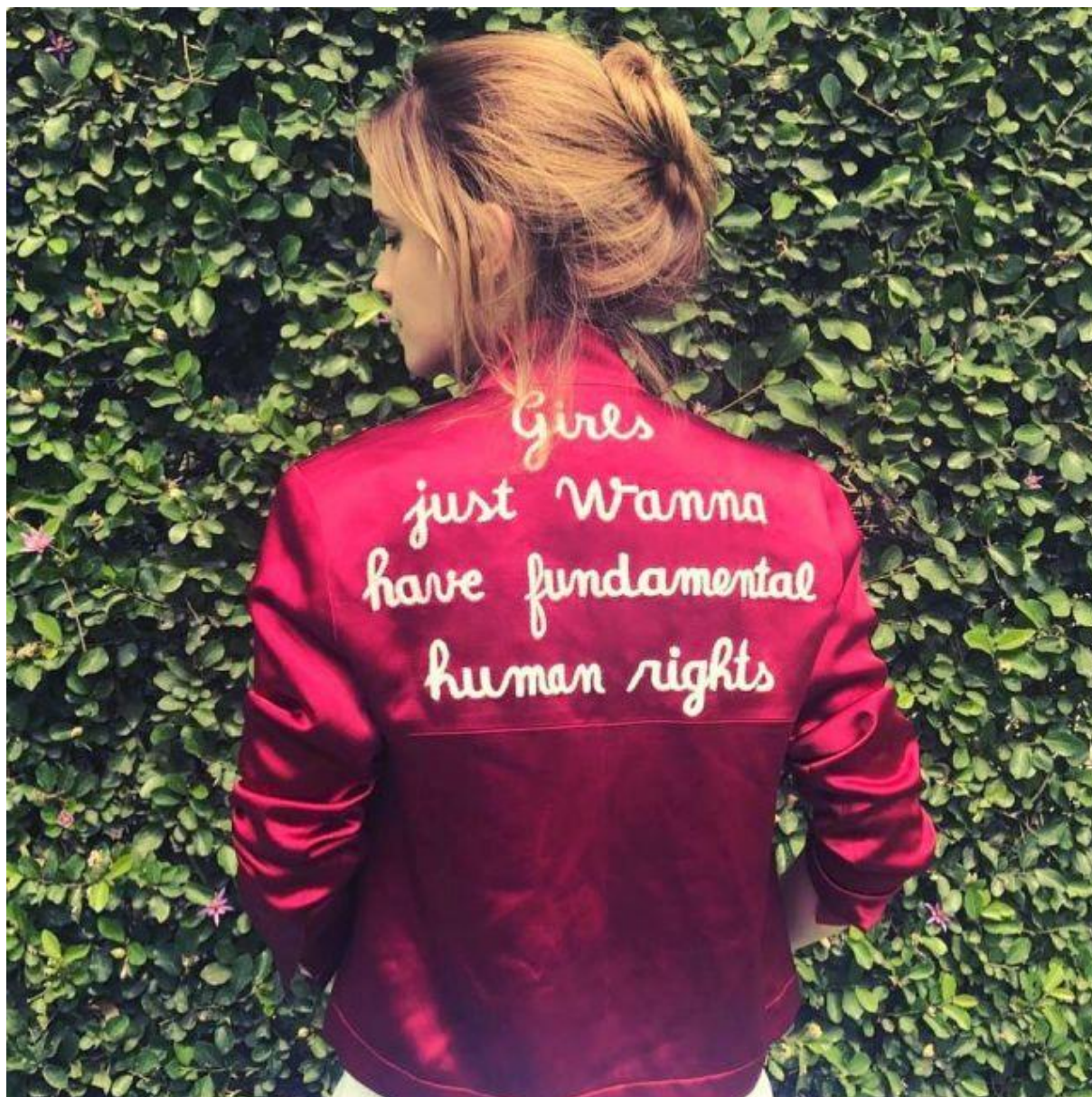
“Emma Watson Wears a Powerful Message for International Women's Day” March 8, 2018

https://people.com/style/emma-watson-international-womens-day-jacket/