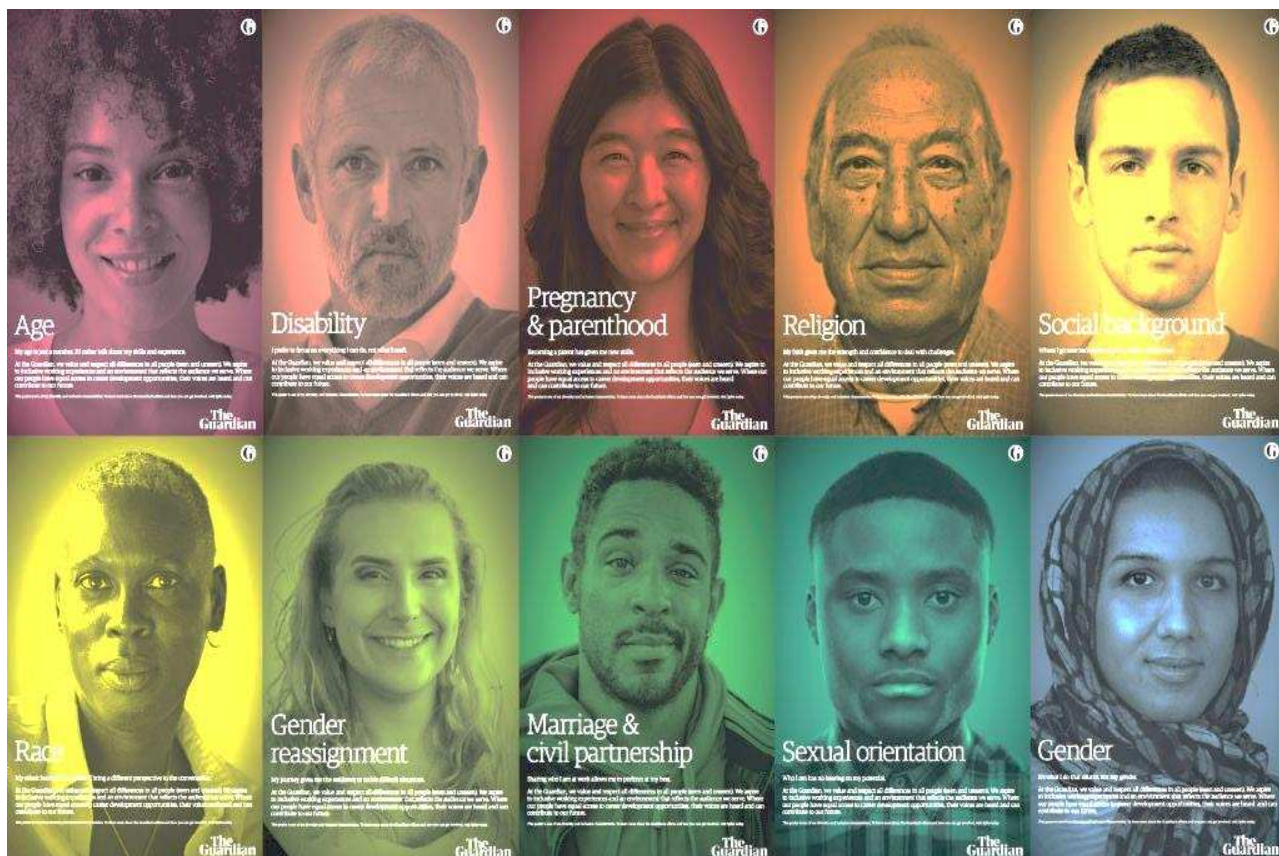
“10 pillars for diversity”, series of posters for an inclusive workplace The Guardian , 2019

https://urbanpartners.london/urban-partners-diversity-inclusion-event-guardian-havas-13-june-2019-impact-hub-kx/