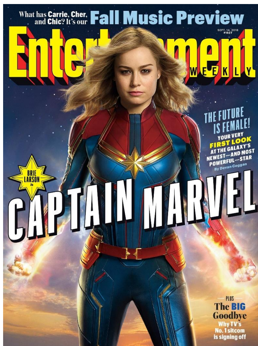
Cover of Entertainment Weekly magazine featuring Brie Larson as Captain Marvel, September 14, 2018