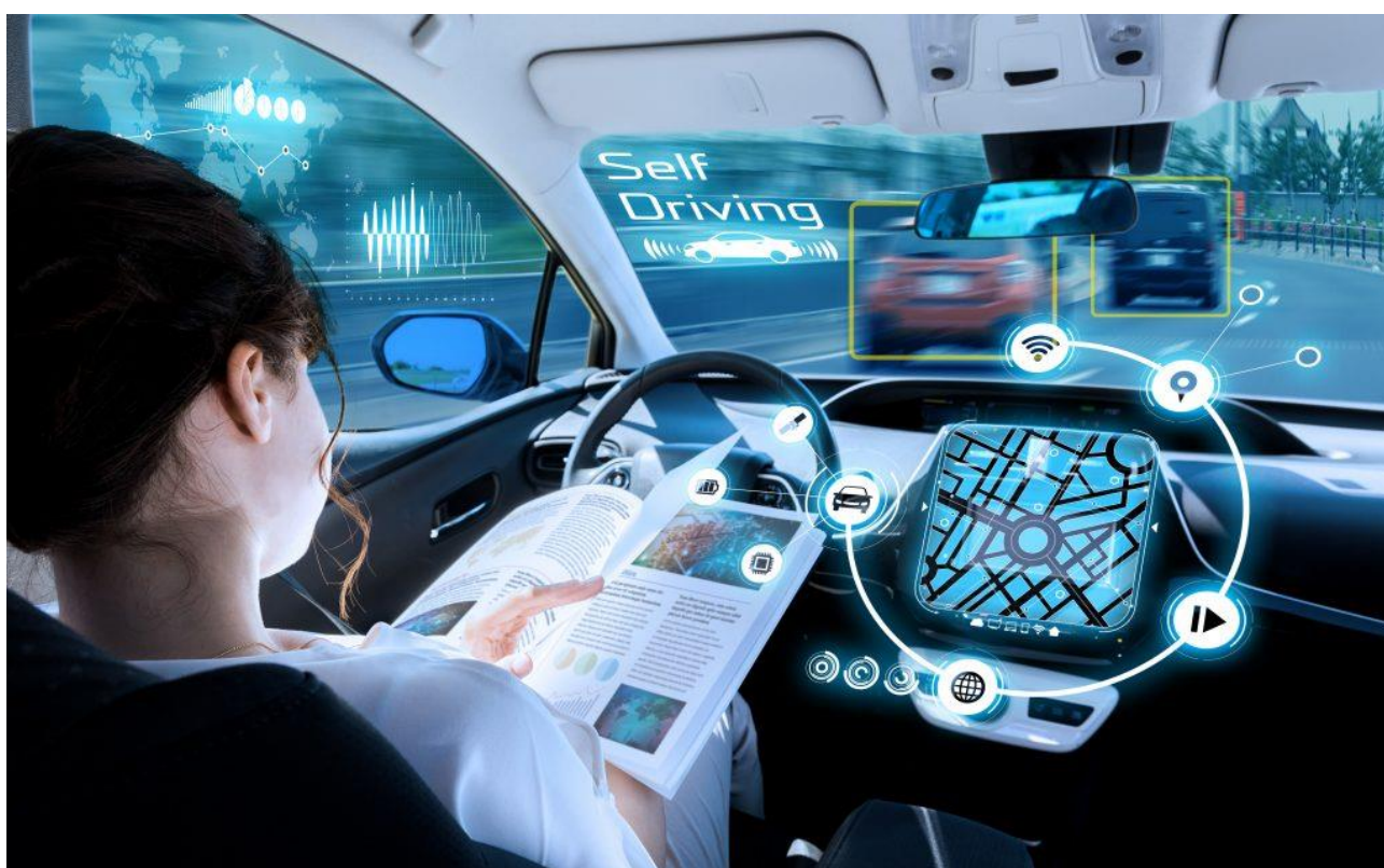
Illustration of “Enthusiasm for self-driving cars to double”, an article by Tara Craig, published in Autonomous Vehicle International , May 15, 2019

https://www.autonomousvehicleinternational.com/news/adas/enthusiasm-for-self-driving-cars-to-double.html