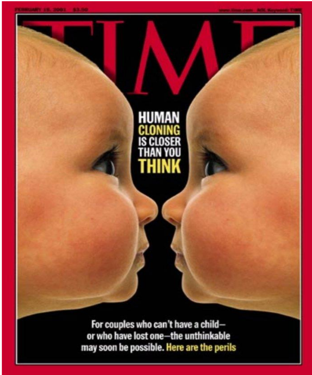
Time Magazine cover, February 19, 2001