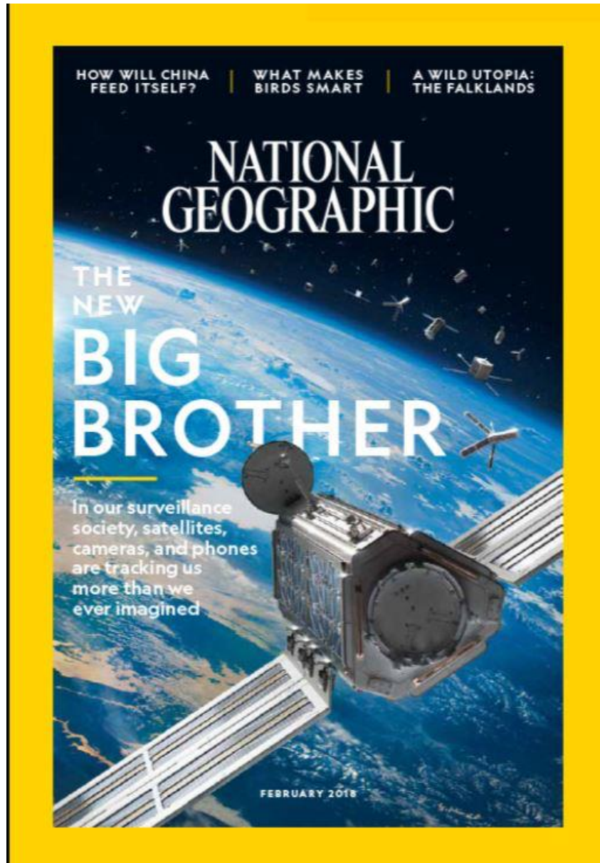
"The New Big Brother", National Geographic magazine cover, February 2018