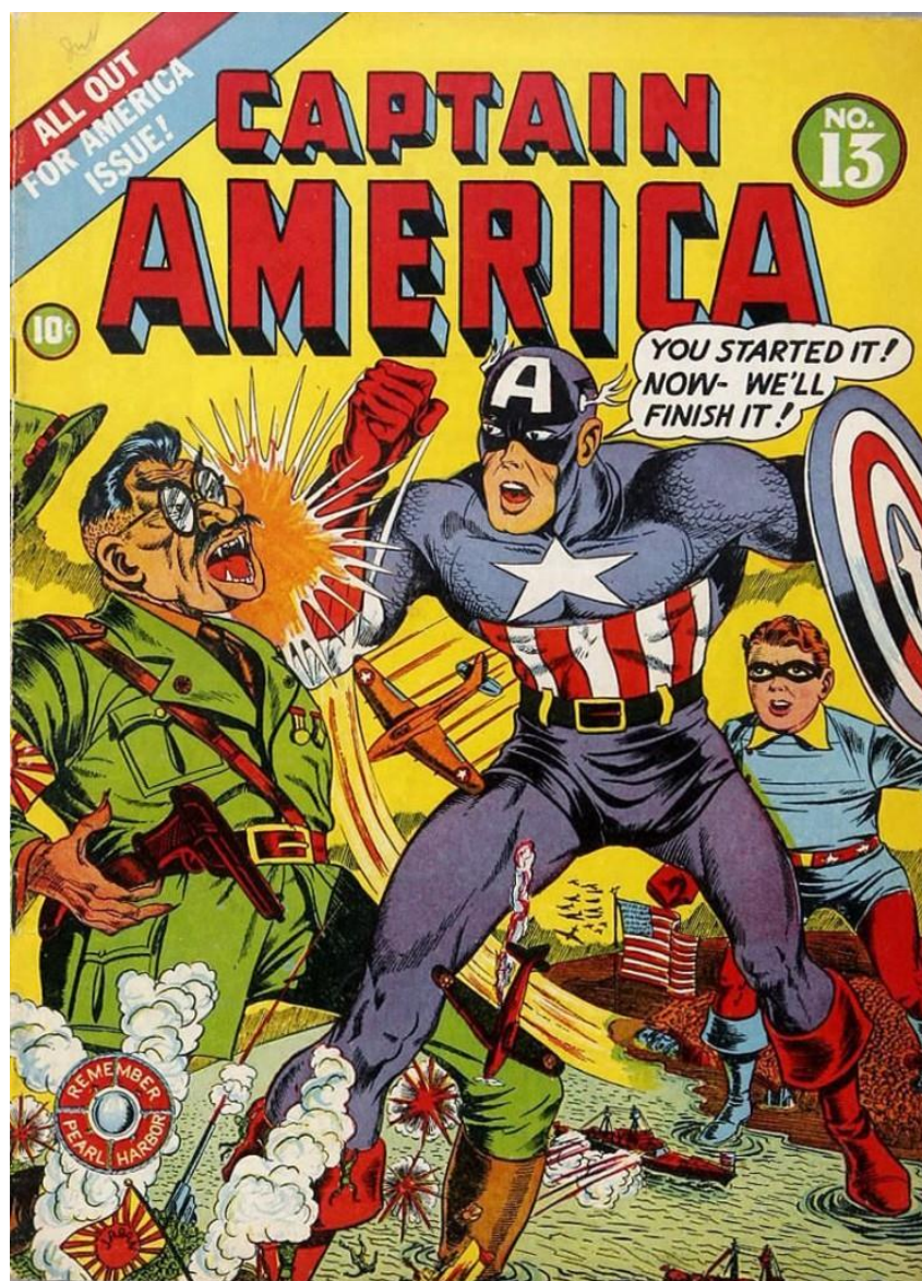
Front cover of Captain America , number 13, 1942

Alfred Dean Avison (1920-1984), American comic book artist