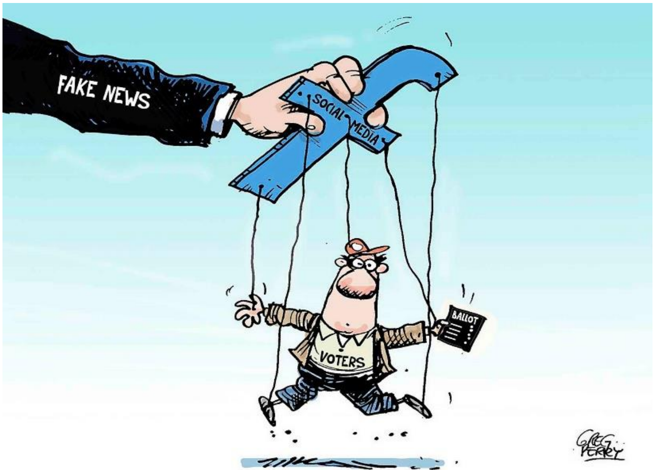
“Fake news and voting”, Greg Perry, Winnipeg Free Press , July 2, 2019