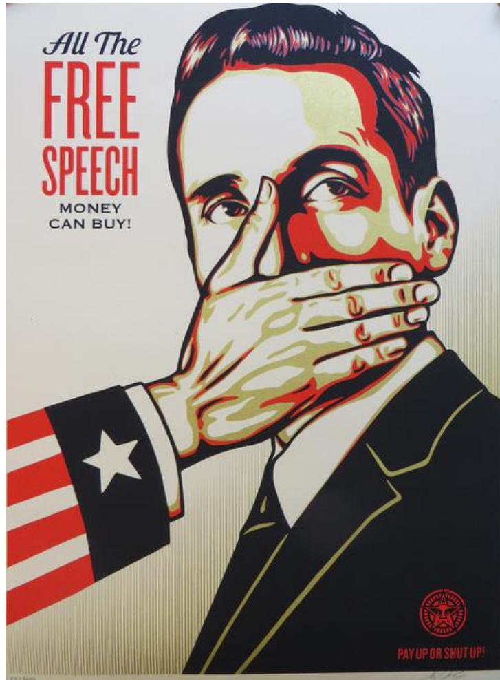
Shepard Fairey (OBEY), All the free speech money can buy , 2015

Art print – Dimensions: 24 in. (60.96 cm) x 18 in. (45.72 cm)