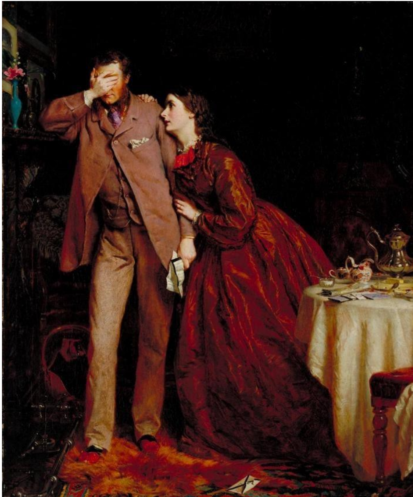
Woman's Mission: Companion of Manhood, 1863

George Elgar Hicks (1824-1914) Oil on canvas, 76.2 x 64.1 cm On display at Tate Britain