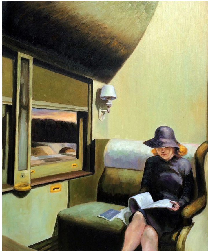
Edward Hopper Compartment C, Car 293 , 1938 Oil on canvas, 50 x 45 cm

© Private collection Photograph © Geoffrey Clements/Corbis