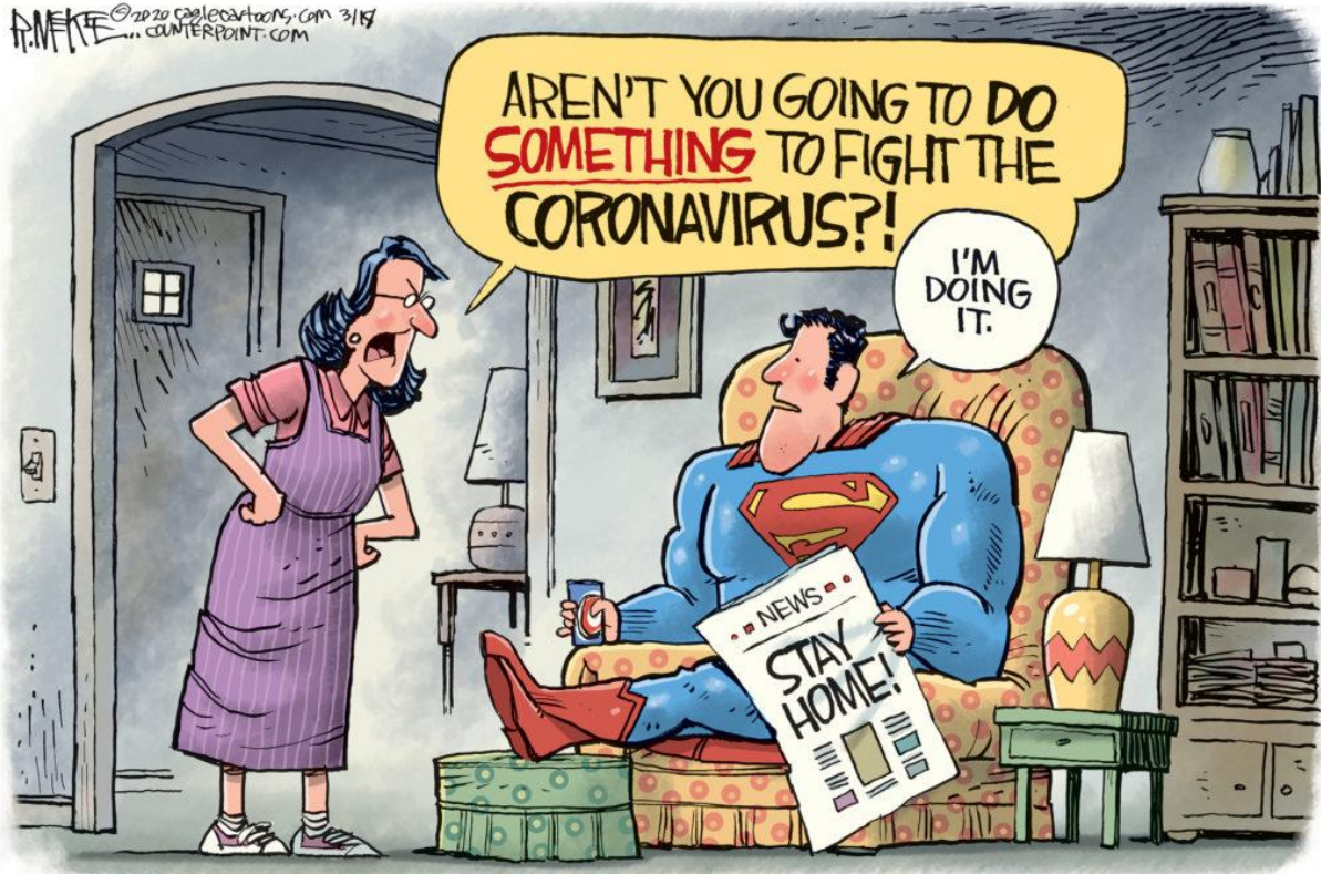
Published in The Augusta (Ga.) Chronicle , U.S., March 18, 2020 | By Rick McKee