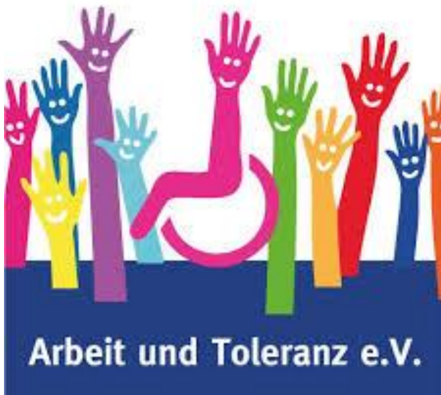
Logo vom Verein Arbeit und Toleranz

https://www.facebook.com/arbeitundtoleranz/