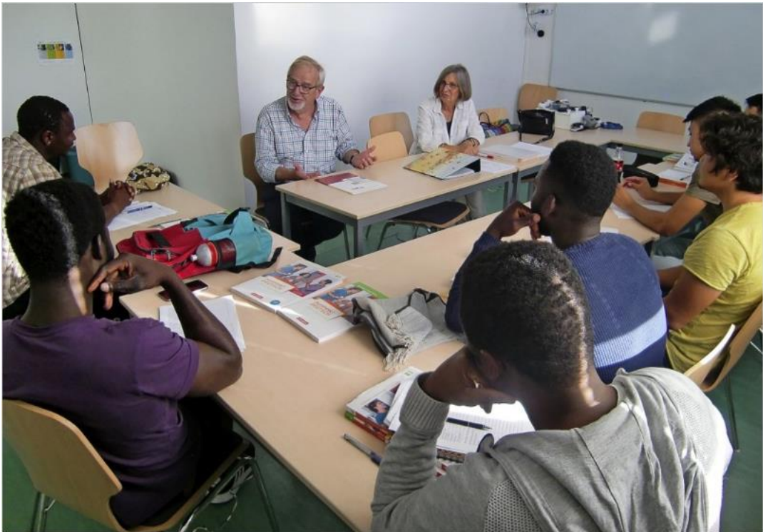
Foto - Neuer Sprachkurs für Migranten, 2019, Offenburg (Schwarzwald)