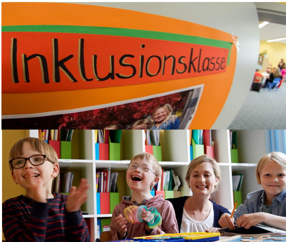
Inklusionsklasse an einer Grundschule