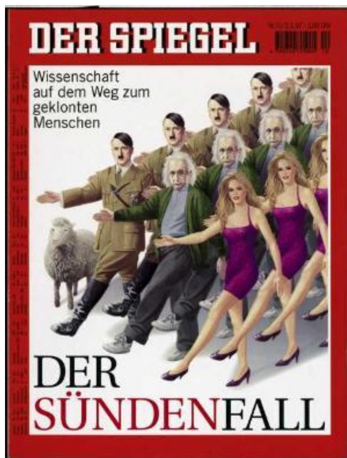
Titelseite – Der Spiegel – 03.03.1997 – Der Sündenfall – Wissenschaft auf dem Weg zum geklonten Menschen