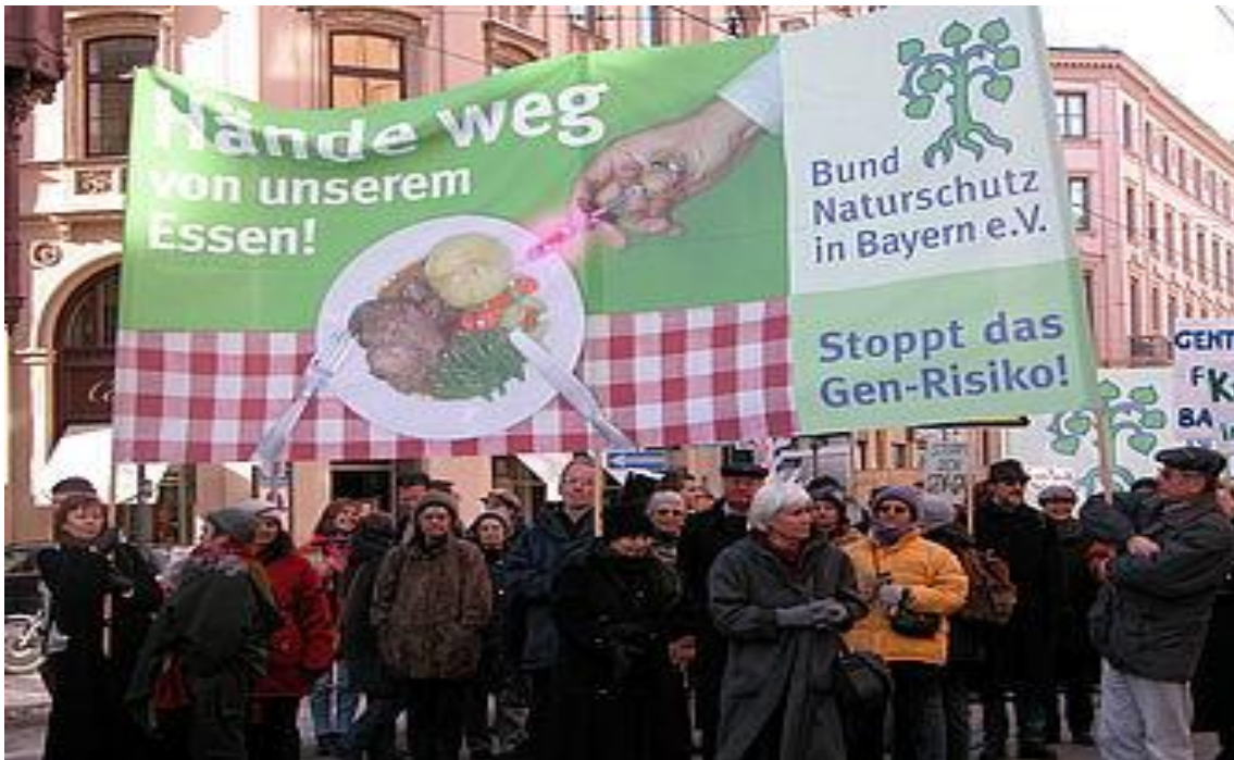
13.11.2019 – Demonstration in Bayern gegen den Anbau gentechnisch veränderter Pflanzen