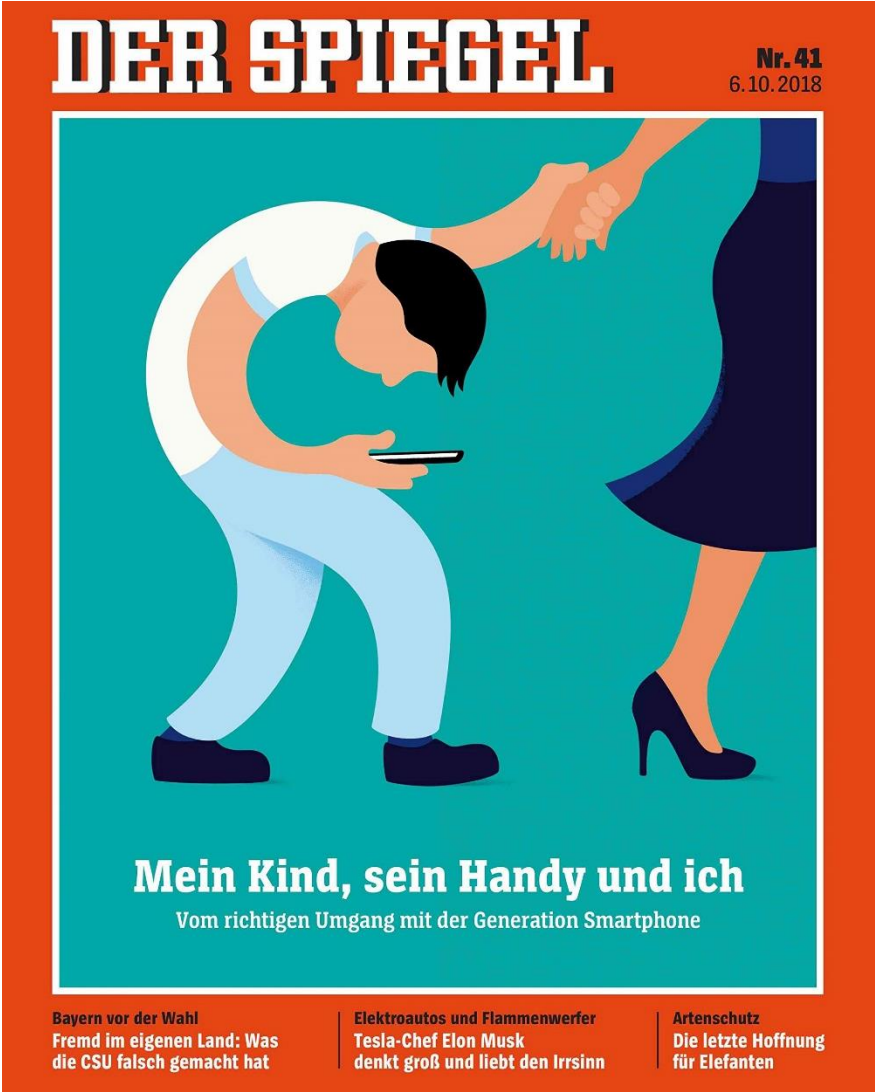
Titelseite: „Mein Kind, sein Handy und ich. Vom richtigen Umgang mit der Generation Smartphone“, Der Spiegel – Nr.41/6.10.2018

Aus: https://www.meine-zeitschrift.de/der-spiegel-44-2018.html