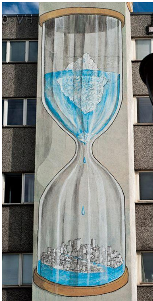
Graffiti vom Künstler BLU – Street Art in Berlin