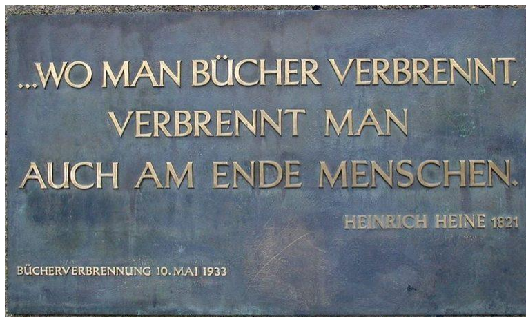
Zitat von Heinrich Heine