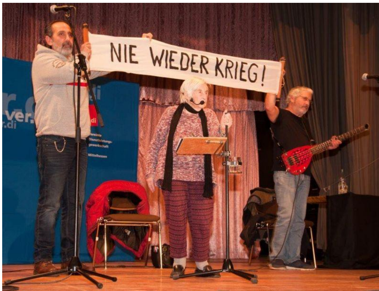
Foto – „Nie wieder Krieg“: Die Auschwitz-Überlebende Esther Bejarano singt mit einer Hip-Hop-Band für Toleranz und gegen Rassismus (2019).