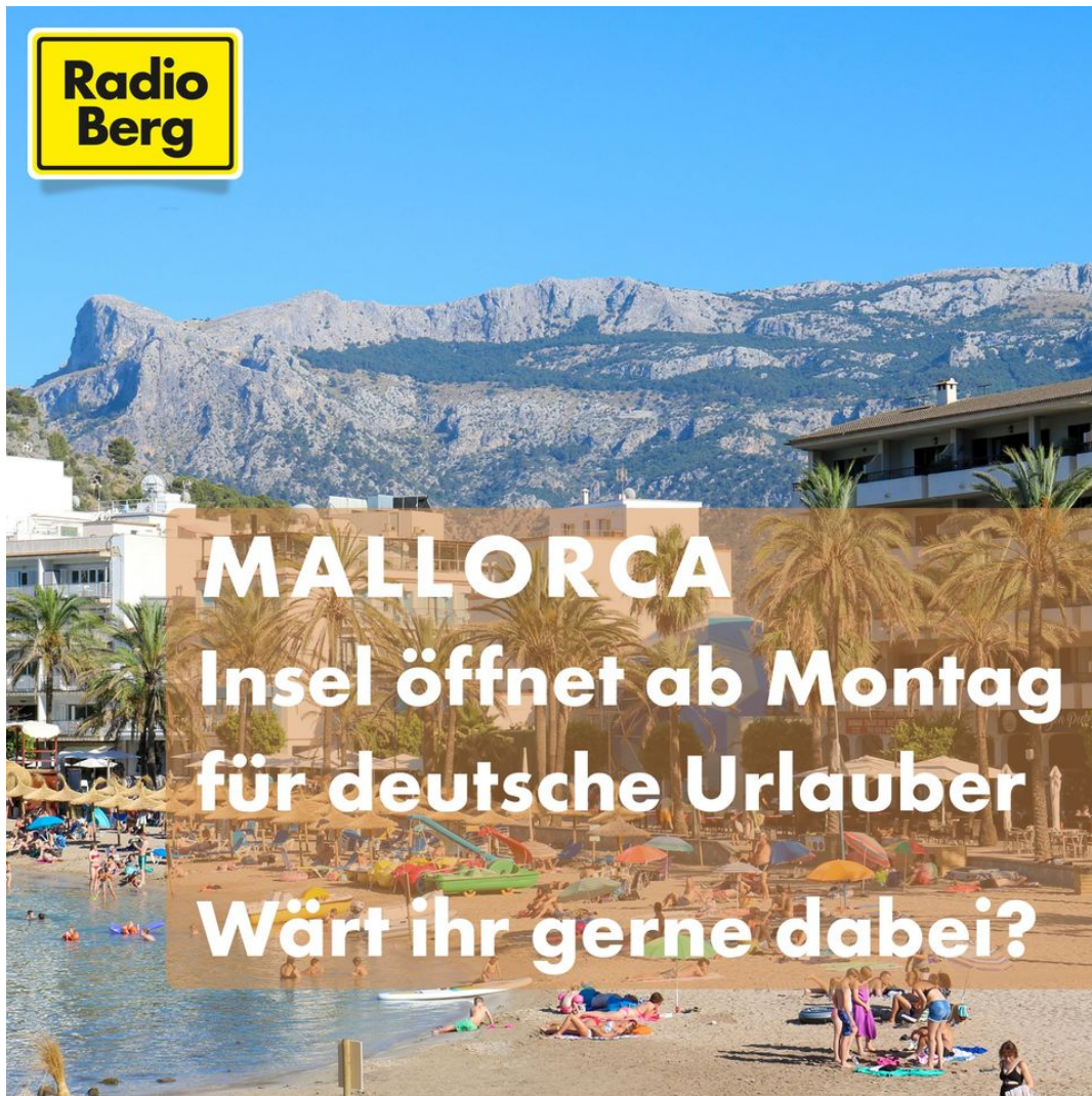
Die Deutschen dürfen wieder auf Mallorca nach der Corona-Krise, Juni 2020