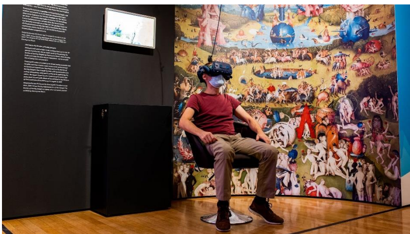
Ausstellung über „Technikvisionen, zwischen Fiktion und Realität“ in Frankfurt/M

Kann der Mensch ohne Fiktion leben? Belegen Sie Ihren Standpunkt mit konkreten Beispielen.