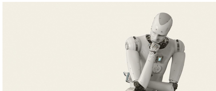
Der Denker, Rosenkreuz.de

Künstliche Intelligenz: Sie wollen sich einen Roboter kaufen, der manches für Sie machen kann. Erfinden Sie das erste Gespräch zwischen Ihnen und dem Roboter.