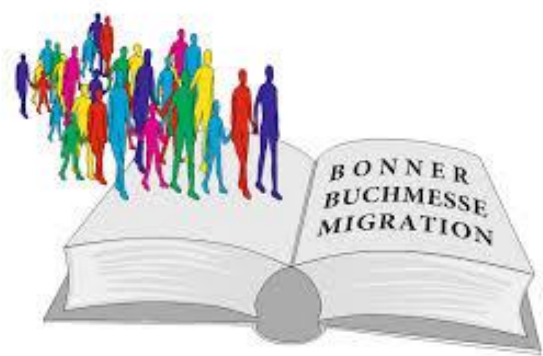
Plakat zur 12. Bonner Buchmesse zum Thema "Migration", 21.-24. November 2019